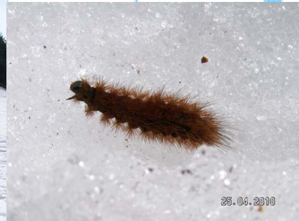
Den här krabaten drog till sig uppmärksamheten i en halvtimme...;-)