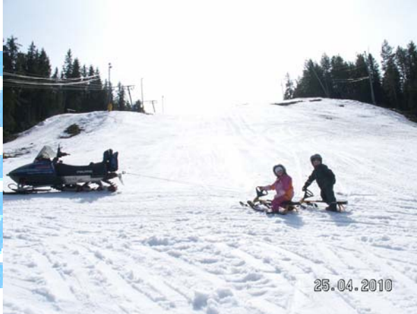
Start uppe i halva branten i tävlingsbacken