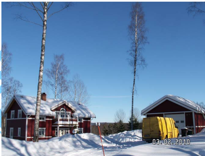
Nog är det fint med vinter!

Nu återstår endast en tävling för säsongen och det är Snowrider Hillcross i Gesunda nu på lördag. Packa fikakorgen, barnen och bobbarna och styr bilen mot Mora! De brukar ha tur med vädret;-).