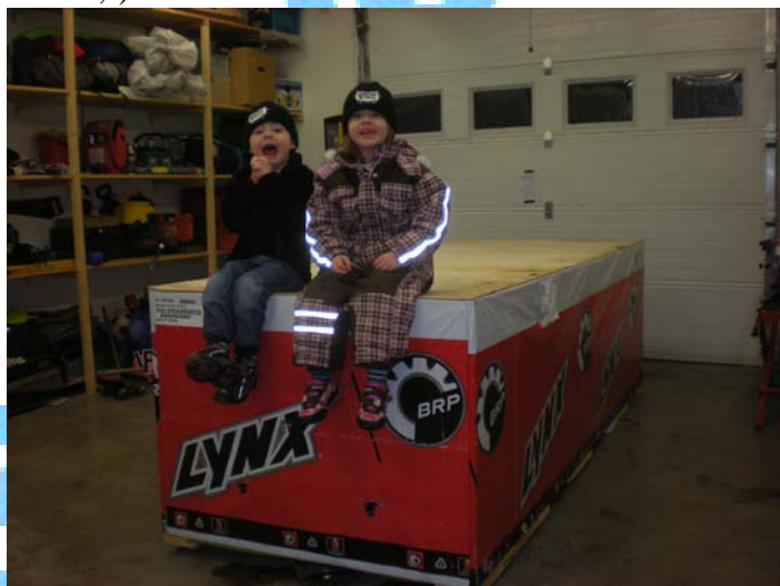
Så här glada blir man när pappa får hem sin julklapp strax innan jul!

Nu är säsongen 2011 igång på allvar och jag har hittills hunnit med två tävlingar och ett antal träningspass på nya Lynxén. Tyvärr kom maskinen lite senare än beräknat så jag missade lite värdefull tränings tid i december men jag hoppas kunna ta ikapp detta "handikapp" innan årets första deltävling i cross SM i Lima i mitten av februari. Träningsuget saknas i alla fall inte...;-)!