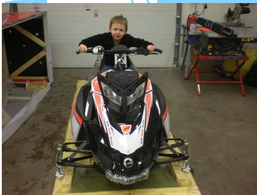
En första "torrbrytning" och testning av kvaliteten.